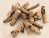
Restos de poda triturados