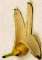
Restos de fruta y verdura