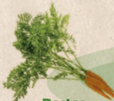
Restos de huerto