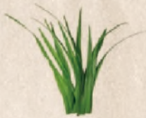
Restos de siega